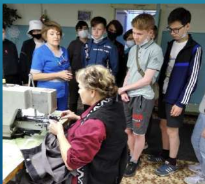
ОАО «Рабочая марка»