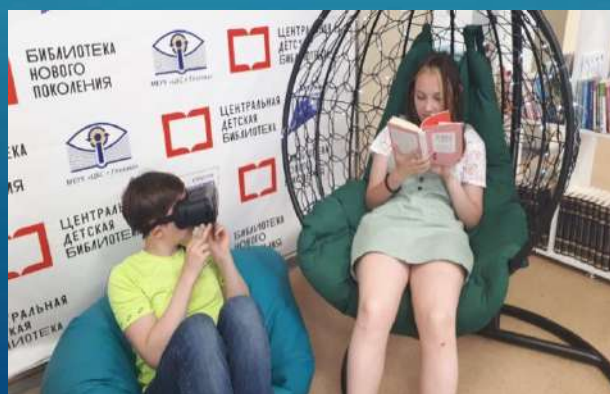
Центральная детская библиотека