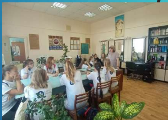
АПОУ УР «ГАПТ»