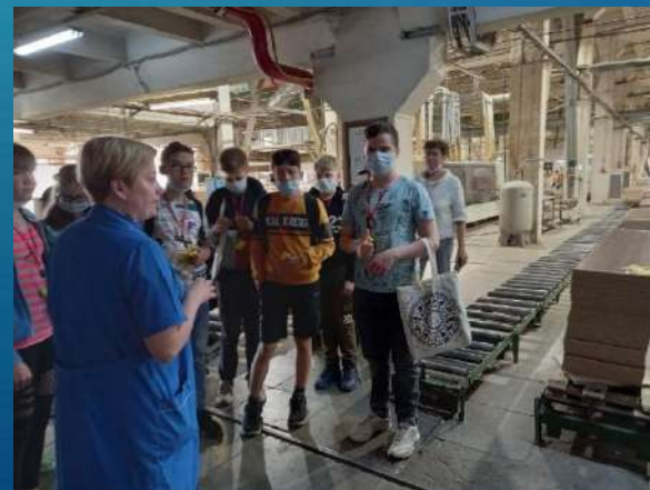
ООО «Глазовская мебельная фабрика»