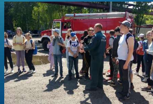
Специальная пожарная часть №2