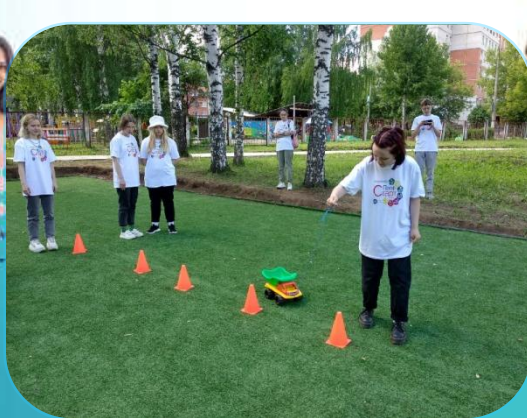
Руководитель соц.-культурных проектов